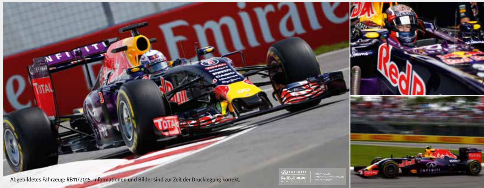
Abgebildetes Fahrzeug: RB11/2015. Informationen und Bilder sind zur Zeit der Drucklegung korrekt.

Die Spannung steigt. Der Druck ist kaum noch auszuhalten. Emotionen brechen sich Bahn. So fühlt sich Partnerschaft an, wenn Technologie, Einfallsreichtum und Leidenschaft aufeinandertreffen. Das Infiniti Red Bull Racing und Sie.